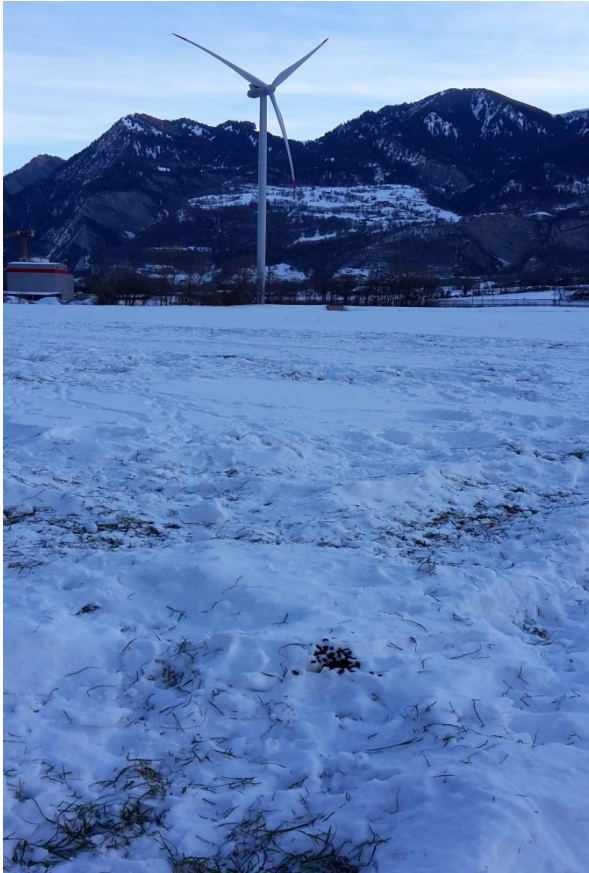
Abbildung 4: Blick aus der Äsungsfläche im Teilbereich 2 Richtung Windkraftanlage (27. Januar, Morgen)

In Bezug auf das Verhalten der Rothirsche in den beiden Testnächten wurde während der Beobachtungszeit konkret Folgendes festgestellt: