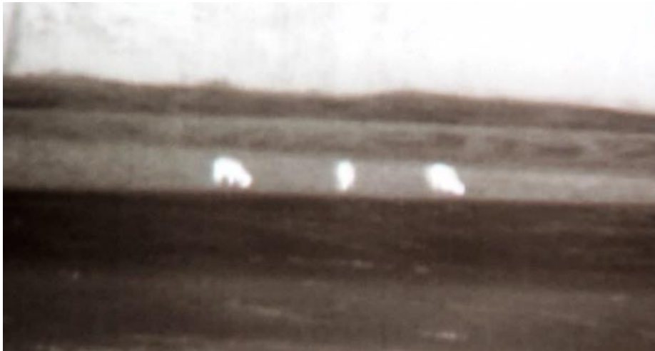
Abbildung 2: Äsende Rothirsche (Blick durch das Nachtsichtgerät)

In beiden Nächten waren im Gebiet während der Beobachtungszeit Rothirsche und Rehe im Untersuchungsgebiet unterwegs. Wie bereits in der Nacht davor (Wildhüter Gadiant, mdl.) traten die Rothirsche erst relativ spät aus. In beiden Testnächten konnten je acht Rothirsche beobachtet werden.