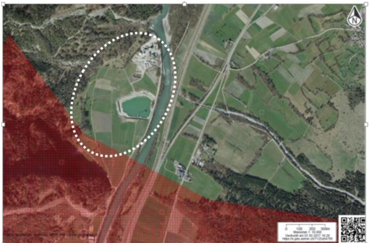
Abbildung 1: Lage des Untersuchungsgebietes (rot eingefärbt ist der Wildtierkorridor)

Das Gebiet dient auch der Naherholung. So werden u. a. regelmässig, in hoher Zahl Hunde ausgeführt. An den beiden Beobachtungstagen kamen die letzten Hundeführer gegen 21 Uhr zurück.