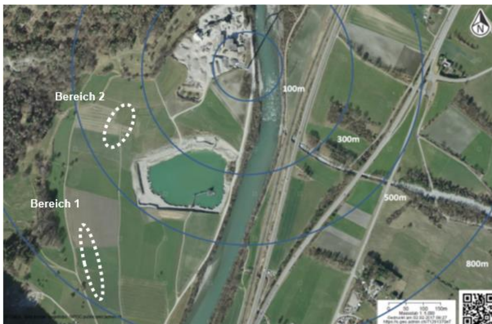
Abbildung 3: Äsungsbereiche der Rothirsche in den Nächten 25./26. und 26./27 Januar 2017

In der ersten Nacht hielten sich die einzelnen Individuen während der Beobachtungszeit im Bereich 1 auf, der 700-800m von der Anlage entfernt liegt (Abb. 3). Dieser wurde auch in der zweiten Nacht von fünf Rothirschen aufgesucht. Zudem nutzten drei andere Rothirsche intensiv auch den Bereich 2, der mit 350-400m eine deutlich geringere Distanz zum Windrad besitzt (Abb. 3 und 4).